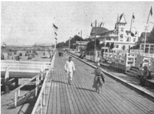
Auf der Cranzer Strandpromenade Vielleicht ist diese Aufnahme an einem Tag im Vorfrühling oder im Spätherbst gemacht worden, an dem Cranz nicht gerade sehr besucht war, — jedenfalls herrschte auf den Brettern der fast zweieinhalb Kilometer langen Strandpromenade sonst ein viel lebhafteres Treiben als es dieses Bild zeigt. Aber es gibt sehr schön die Anlage dieser bekannten Promenade wieder.