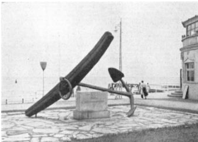
Wikinger schmiedeten diesen Anker Auf der Cranzer Strandpromenade war neben dem Café „Elch“ dieser zwanzig Zentner schwere Anker aufgestellt. Er war von einem Kutter in der Cranzer Bucht durch Zufall im Schleppnetz vom Grund des Meeres heraufgeholt worden.