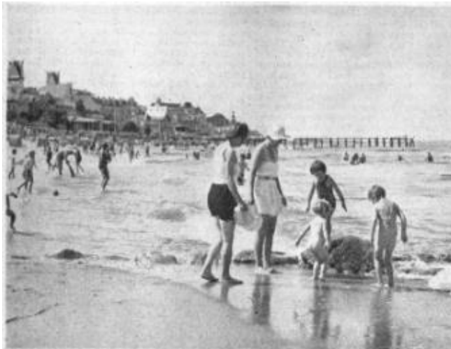
Erste Bekanntschaft mit der Ostsee Die kleine Marjell im Mittelpunkt der Gruppe vorne rechts wagt sich nur vorsichtig an das große Wasser heran. — Im Hintergrund rechts sieht man den Seesteg, links die Cranzer Strandpromenade mit dem „Monopol“.